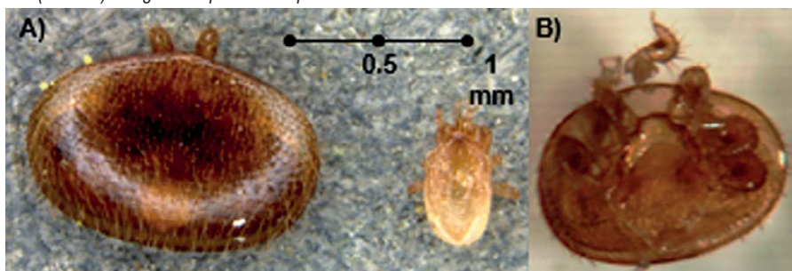
Taille comparative d'un acarien Varroa destructor adulte (à gauche) et d'un acarien Stratiolaelaps scimitus (à droite) + Signes de prédation / patte arrachée cf. biblio N° 6